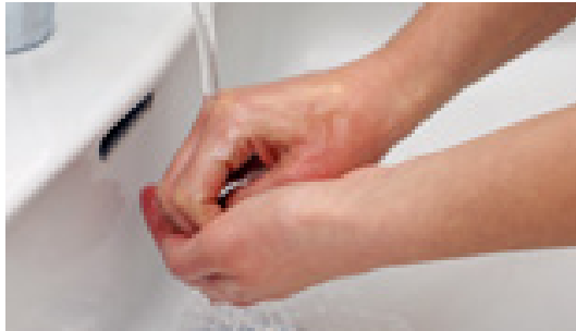
1. Hände unter Wasser halten